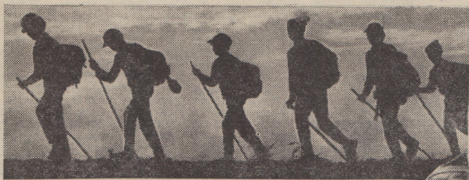
ЧАСОВОЙ В КРАСНОМ ГАЛСТУКЕ СТРОГО СПРОСИЛ: «ПАРОЛЬ?»