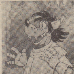
Рис. В. КОВАЛЯ

Постоянный автор приключений — режиссёр киностудии «Союзмультфильм» В. Котёночкин сказал: «Будет и тринадцатый выпуск. Про участие Волка с Зайцем в играх XXII Олимпиады в Москве. В этом выпуске появится ещё один зверь. Попробуйте сами догадаться, какой...»