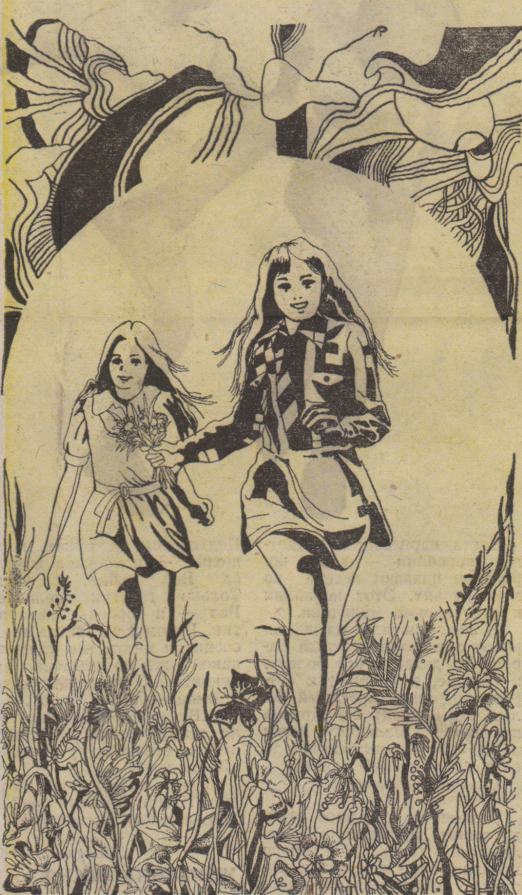
Рис. Л. РЯВИНИНА

— Трудная, говоришь? Какой же ты в таком случае избач? Ты должен её прочесть. Знающие люди гово-